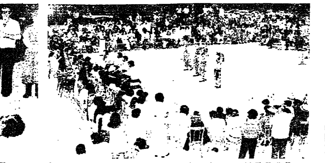
الفرقة التولكورية تؤدي احدى رقصاتها